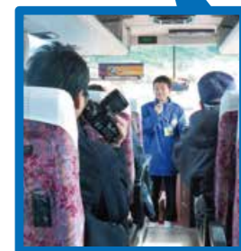
合格率わずか1.6%の非常に難しい検定に合格した優秀な地元の子供ガイド

[往復乗車料金] 大人 320円、大学・高校生 250円、中学生以下 120円 ●バス乗車チケットの提示で、クレインパークいずみ、ツル観察センター入場無料 車内では、出水の歴史や自然に詳しい専門家と、ツルガイド博士検定に合格した子供ガイドがご案内します。